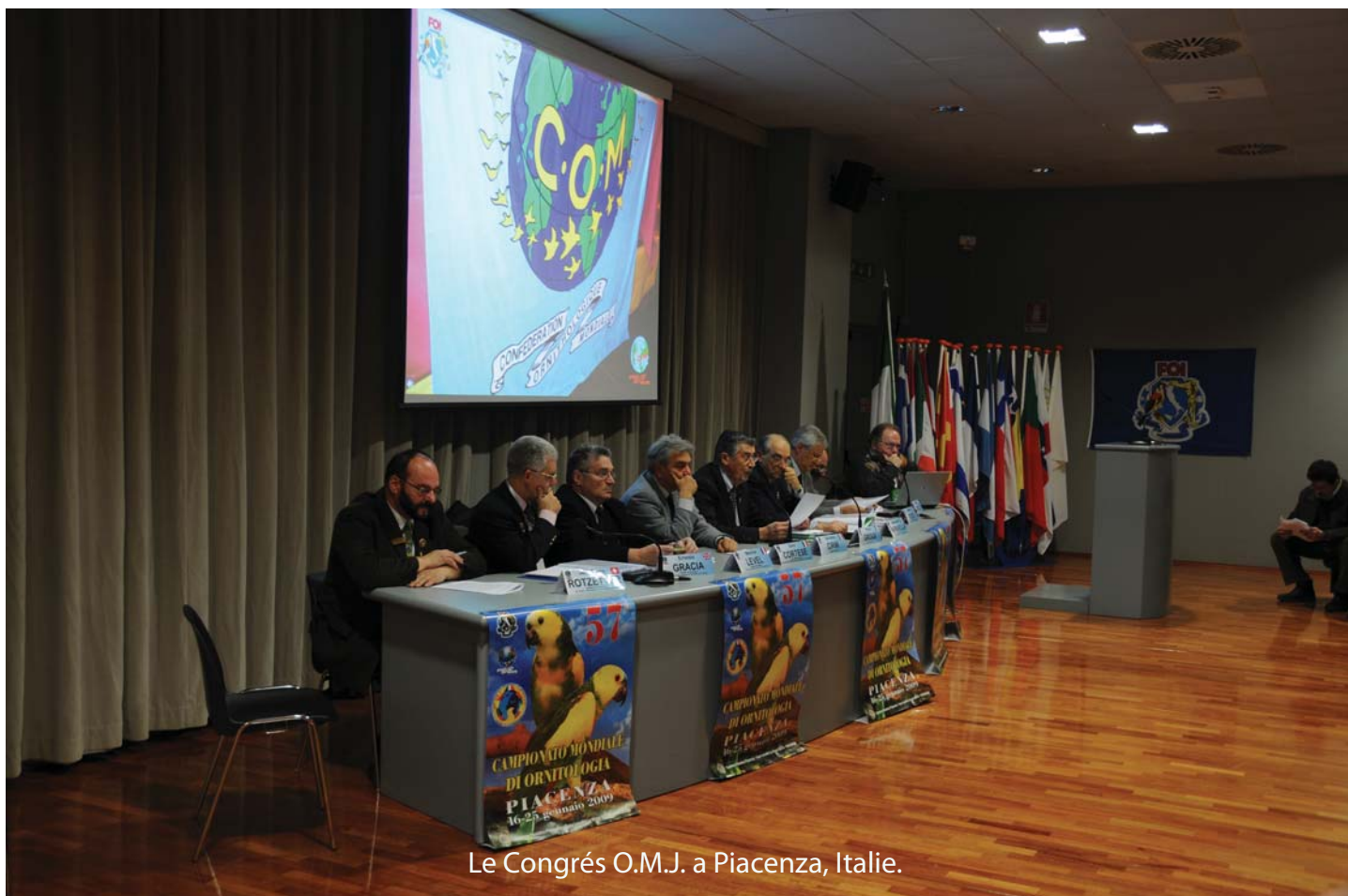
Le Congrès O.M.J. a Piacenza, Italie.